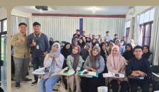
Kegiatan Mahasiswa Suasana Perkuliahan