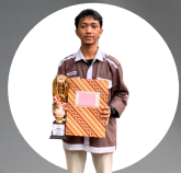
JUARA 2 CABANG MENYANTRI DASU (KATEGORI PUTRA) POKSI MINDO 2024