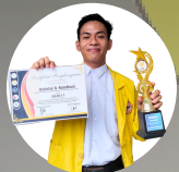
JUARA 1 DESAIN POSTER TINGKAT NASIONAL 2024