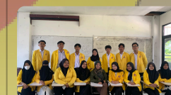
Kegiatan Mahasiswa Melaksanakan MID/UAS Mata Kuliah