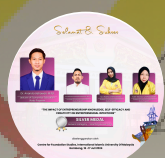
SILVER MEDAL GENERAL CATEGORY - TEACHING & LEARNING 2024