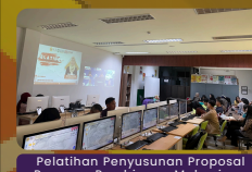
Pelatihan Penyusunan Proposal Program Peminatan Mahasiswa Wirausaha (P2MW)