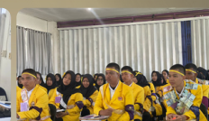
Kegiatan Mahasiswa PKKM Program Studi