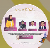
BRONZE MEDAL GENERAL CATEGORY - INNOVATION 2024