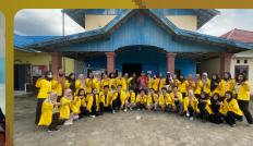
Pengabdian dan Penelitian di Desa Karang Indah Bersama Dosen