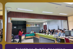
Pelatihan Public Speaking