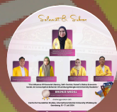
BRONZE MEDAL STUDENT CATEGORY - MANAGEMENT & ADMINISTRATOR 2024