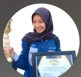
BEST VOLUNTEERS KATEGORI LEADER DESA BINAAN MUDA AWARDE 2023