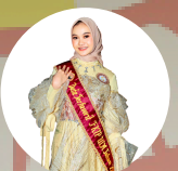
DUTA TERAVORTE PKP ILMU 2024