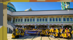
PKL Mata Kuliah Kewirausahaan di Negara Kab. Hulu Sungai Selatan