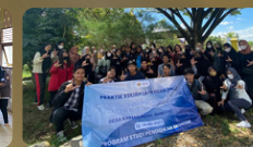
PKL Penelitian, Pengabdian, dan Studi Perilaku Masyarakat di Desa Karang Indah