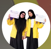
JUARA 3 & BEST SPEAKERS LOMBA DEBAT MAHASISWA INDONESIA (KDM) 2024