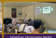
Pelatihan Pembuatan Media Pembelajaran Berbasis Powtoon