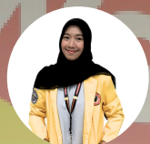
SEA TEACHER BATCH 01 UNIVERSITY OF THE IMMACULATE CONCEPTION PHILIPPINE