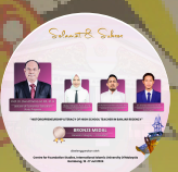
BRONZE MEDAL GENERAL CATEGORY - INNOVATION 2024