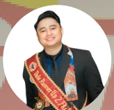
DUTA RUNNER UP 2 PKP ILMU 2024