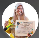
JUARA 1 MEDIA PEMBELAJARAN DIGITAL KATEGORI SOSIUM TINGKAT NASIONAL 2023