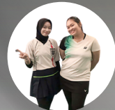
JUARA 1 BADMINTON GANDA PUTRI TINGKAT UNIVERSITAS 2024