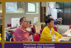
Pelatihan Penyusunan Proposal PPK Ormawa