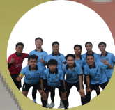
JUARA 1 FUTSAL TOURNAMENT (TIM BOLA VOLI) 2024