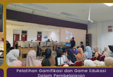
Pelatihan Gamifikasi dan Game Edukasi Dalam Pembelajaran