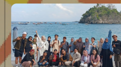
Pratik Kuliah Lapangan Kunjungan UKM di Nusa Penida Bali