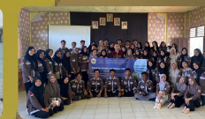
PKL Mata Kuliah Kewirausahaan di Desa Bakumpai