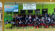
Penyaluran Paket Pendidikan Berlian Bersama HIMAPENKO FKIP ILMU di SDN Basirih 10 Banjarmasin