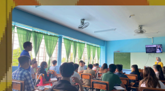
Pengajaran di University The Immaculate Conception Philippines