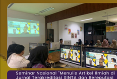
Seminar Nasional "Menulis Artikel Ilmiah di Jurnal Terakreditasi SINTA dan Bereputasi