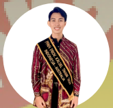
PERwakilan PPRP PKP ILMU 2024 INDONESIA AUSTRALIA