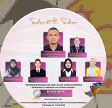
SILVER MEDAL GENERAL CATEGORY - MANAGEMENT & ADMINISTRATOR 2024