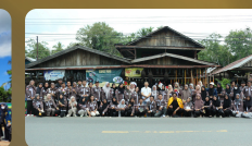
PKL Mata Kuliah Ekonomi Kreatif di Desa Panggung